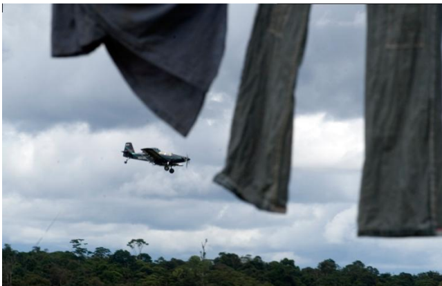
Fotografía 12. Avioneta sobrevolando un resguardo Awa tras asperjar glifosfato. Nariño. Míngorance, 2008.

En este capítulo se desarrolla otro hilo del tejido de esta investigación, una trama de significados a propósito del contexto de violencia en el cual están ubicadas las comunidades Inga de la BBC. Centra su atención en la problemática de los cultivos de