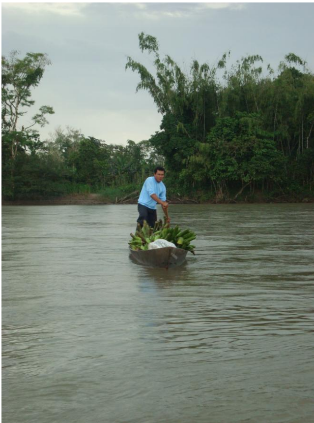
Fotografía 15. Transportando plátano por el río Fragua.

El “saber vivir ahí” como principio no es estático, precisamente en el trasegar histórico de las comunidades Inga lo que se logra identificar es que cambia en la medida de unos contextos, de los encuentros con el otro (Inga, colonos, campesinos, funcionarios del Estado, investigadores), de sus traslados y desplazamientos por el territorio nacional e