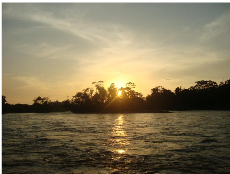
Fotografía 1. Atardecer navegando por el río Fragua.