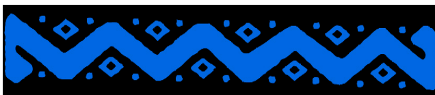
Fotografía 8. Ideograma de la Amarun. Pueblo Inga, 2011.

Ciclo que se refleja en varios de los ideogramas 31 plasmados en el chumbi , por ejemplo: la amarun –serpiente- mítica bicéfala, que representa por una parte el movimiento cíclico del tiempo y por otra el kuichi , -arcoíris- hijo del agua y del sol, de la unidad del Hanan Pacha con el Urin Pacha –mundo de arriba y mundo de abajo-(Pueblo Inga, 2011).