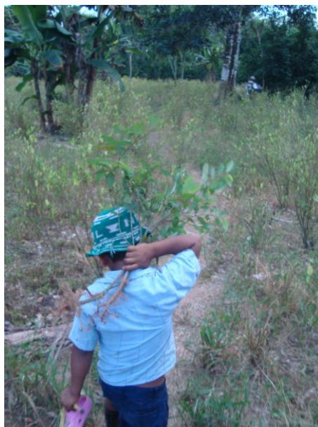
Caminando hacia la mata de zapote. 2013.

la palabra-: territorio, “saber vivir ahí” y pensamiento Inga