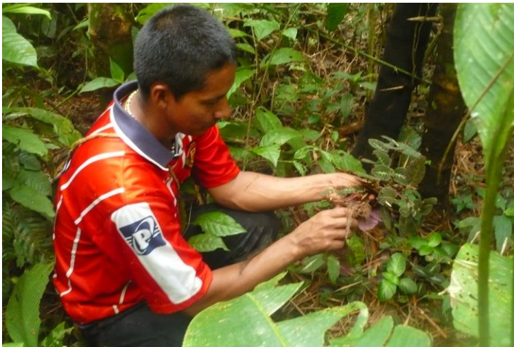
Fotografía 9. El compadre Gerbacio recogiendo medicinas. Ortiz, 2013.

La palabra, así como la vida, como los conocimientos, se siembra, se cuida y se recoge. Vamos caminando y sembrando, vamos recogiendo de eso que hemos sembrado, es decir, de eso que somos. Pero también en ese camino con los otros, recibimos y ofrecemos pensamientos, vida, historias, palabras. “saber vivir ahí” entonces también comprende sembrarse en un lugar, dar cosecha y regar de eso mismo que uno se va haciendo, para de esta manera también recrear los lugares en los que se habita, recrear Nukanchipa Alpa Mama .