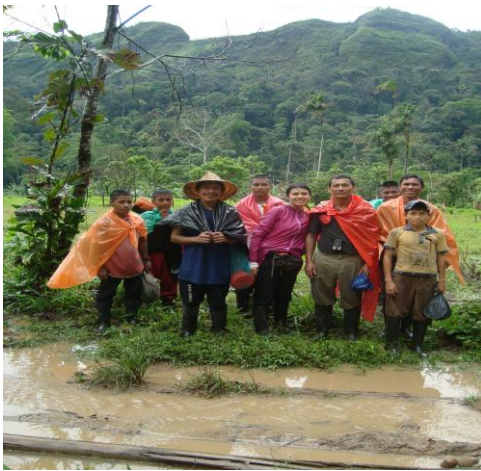
Fotografía 2. Caminando hacia el Fragua Viejo. Al fondo Serranía de los Churumbelos. BBC. Chamorro, 2012.

Nos vamos mezclando, nos vamos siendo y haciendo color, por aquí pintan esas historias de cómo se sabe vivir ahí... no de cómo se vive, es de cómo se es de aquí, a la vez que se hace (diario de campo, noviembre de 2010).