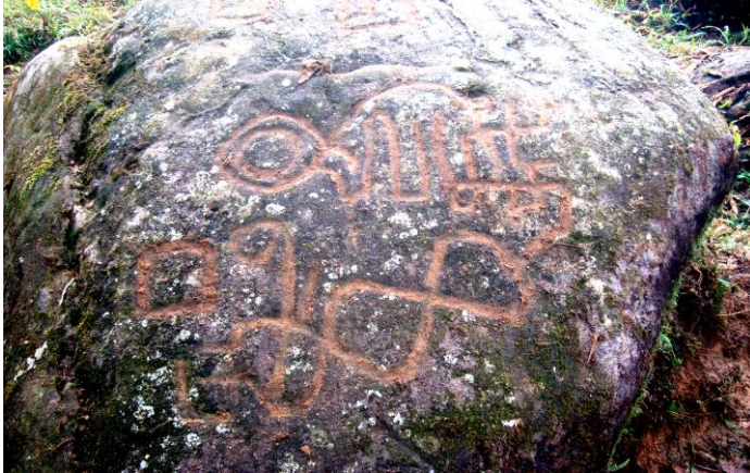
Fotografía 11. Petroglifos repintados con barro, en la BBC.

mugre, como para quitárselas?”. Ratificando que “la bifurcación occidental entre lo vivo y no-vivo, lo orgánico e inorgánico, lo animado e inanimado, lo humano y no-humano, no es una concepción transcultural al ámbito andino (Esterman, 1998:176).