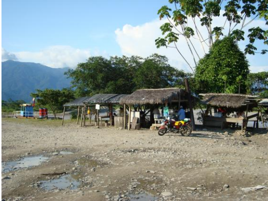
Fotografía 1. Casetas de venta de empanadas de cambray. El Jauno (a orillas del Caquetá, límites con el departamento del Cauca).